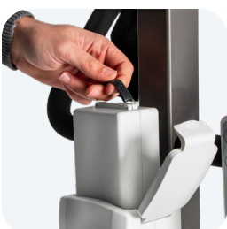
Batería de 2,2 Ah de litio extraíble