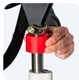
Bajada de emergencia con pistón manual