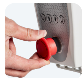
Botón de parada de emergencia