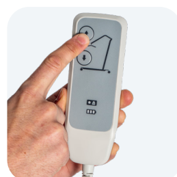
Elevación eléctrica desde el mando o caja