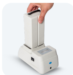
Cargador inalámbrico (accesorio)