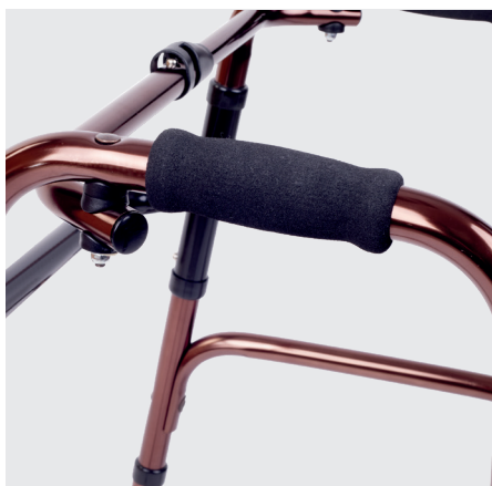
Empuñaduras de neopreno