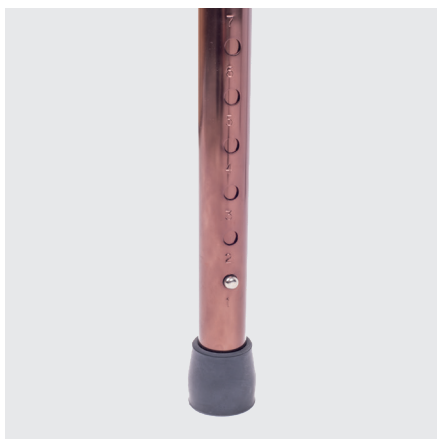
Regulable en altura