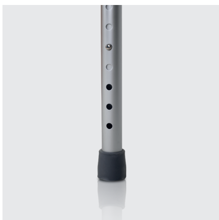
Regulable en altura