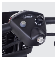
Panel de control