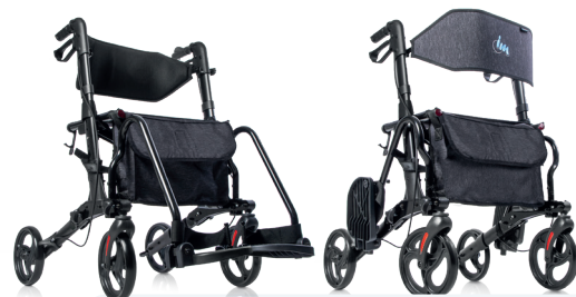
ANDARILHO MULTIFUNÇÕES 2 EM 1 ANDARILHO COM APOIO PARA OS PÉS