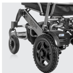
Nuovo sistema di rimozione della batteria migliorato (batteria da 12, 20, 30 e 40 Ah)