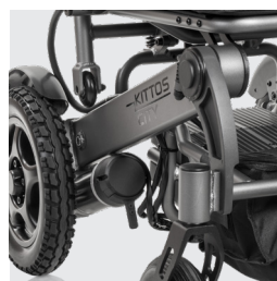
Nuovo sistema di facile accesso per collegare/scollegare il motore