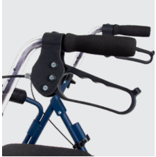
Freno de maneta