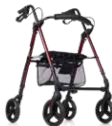
CR04 FM R8