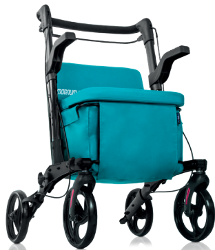
MAGNUM SHOP PLUS