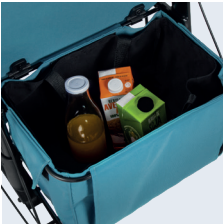
Cesto de grande capacidade