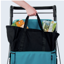
Saco interior amovível