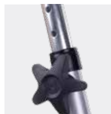
Regulable en altura