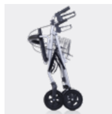
Plegado del andador 4200XL.