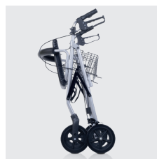
Dobragem do andarilho 4200XL.