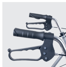
Alavanca de freio.