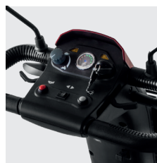
Pannello di controllo