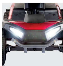
Luce a led anteriore