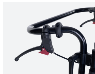
Maniglie per reclinare lo schienale