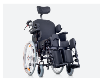
Balance 11 con accessori