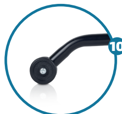
Barra estabilizadora (de série)