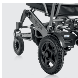
Novo sistema melhorado de remoção da bateria (bateria de 10, 20 ou 30Ah)