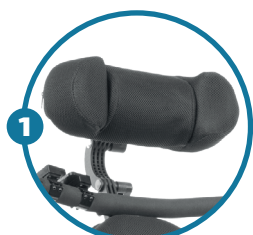
Apoio de cabeça