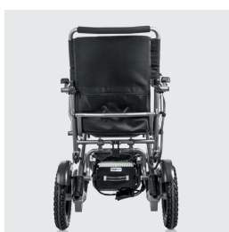
Largura total 59,8 cm Permite a passagem fácil através de portas