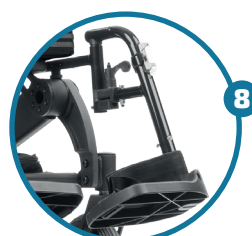
Apoios para os pés individuais amovíveis e reguláveis em altura