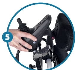
Controlo de acompanhamento fixo ou amovível