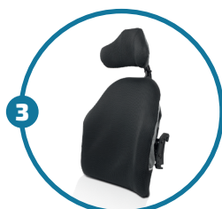
Encosto e apoio de cabeça NXT