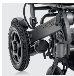
Novo sistema de acesso fácil para ligar/desligar o motor