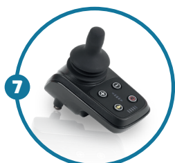
Controlo remoto Bluetooth