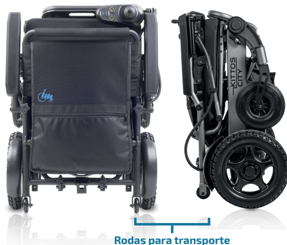
Rodas para transporte