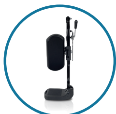
Apoios para os pés individuais e eleváveis