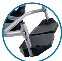
Apoios de pés individuais fixos