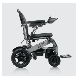
Peso total sem pilhas 29,30 kg