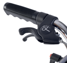
Maniglie per reclinare lo schienale