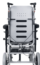
Schienale in alluminio rinforzato