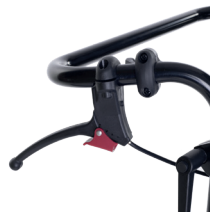
Maniglie per reclinare lo schienale