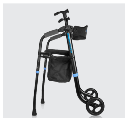
Elite 3G Up lateral