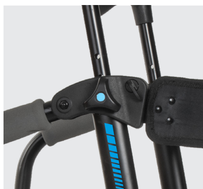
Elite 3G Up regulável em altura