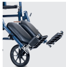
Apoios de pés eleváveis