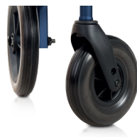
Ruote anteriori larghe 5 cm