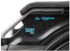
Apoio de braços dobrável