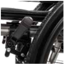
Travão de alumínio