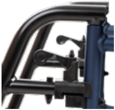
Apoios de pés amovíveis