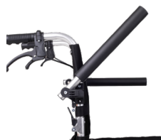
Apoio de braço dobrável