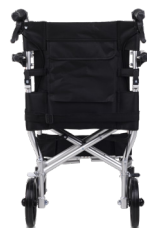
Cinto de segurança