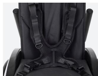
Arnês de segurança