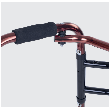
Impugnature in neoprene