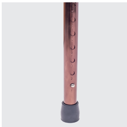
Regolabile in altezza