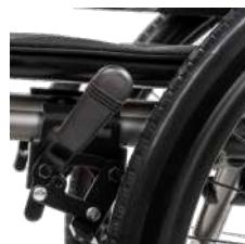
Freno de aluminio