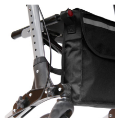
Cesta de gran capacidad.