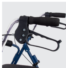
Freno de maneta