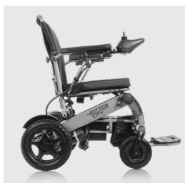
Peso total sin baterías 29,30 kg