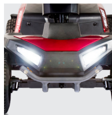
Luz led delantera