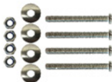
4 ARANDELAS, 4 TORNILLOS Y 4 TUERCAS