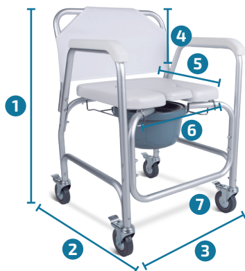
SILLA 8800-U CON ACABADO CROMADO