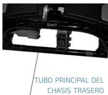
TUBO PRINCIPAL DEL CHASIS TRASERO

Para volver a montar, deje que la sección trasera del scooter descansa hacia atrás sobre las ruedas antivuelco. Levante la sección delantera por el poste del asiento hacia la sección trasera y ubique las agarraderas en cada lado del chasis sobre el tubo principal de la sección trasera como se muestra a continuación. El frente se puede bajar suavemente hasta su posición. Cuando baje, empuje hacia abajo el poste del asiento y escuchará que las secciones delantera y trasera encajan en su lugar. Para garantizar una conexión segura, tire del poste del asiento para asegurarse de que la parte trasera esté conectada correctamente.