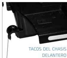
TACOS DEL CHASIS DELANTERO