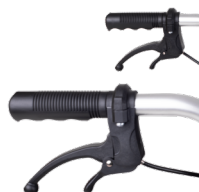
Manilla de freno de mano