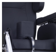
Taco abdutor (acessório)