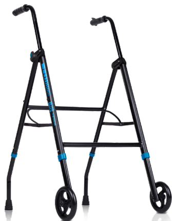
elite 1G IM BY TOTALCARE

Los andadores Elite están diseñados con un sistema de fácil plegado para un cómodo transporte y pensado para ahorrar espacio a la hora de guardarlo en interiores.