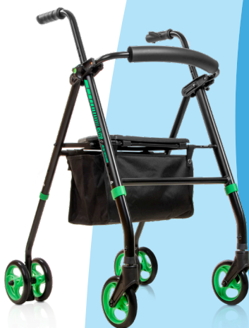
elite FP IM BY TOTALCARE