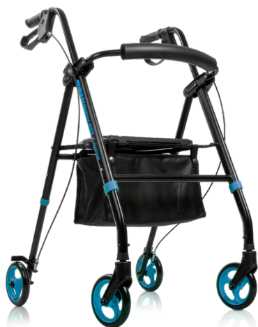
elite FM IM BY TOTALCARE