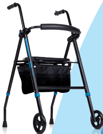
elite 3G IM BY TOTALCARE